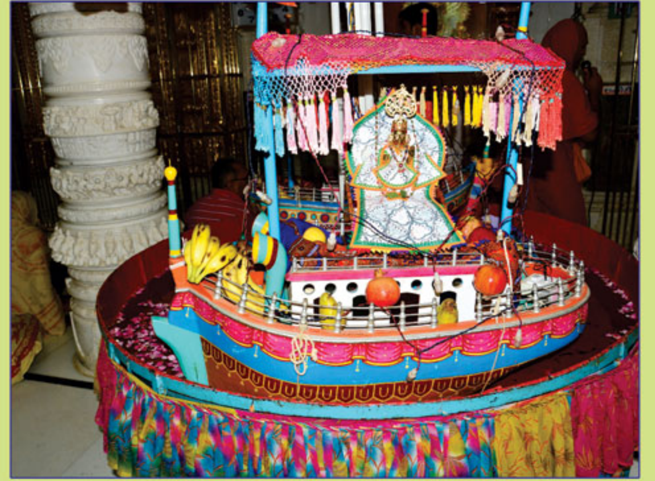
જલઝીલાણી એકાદશીના જળમાં વિહાર કરતા શ્રીહરિકૃષ્ણ મહારાજ, ભુજ.