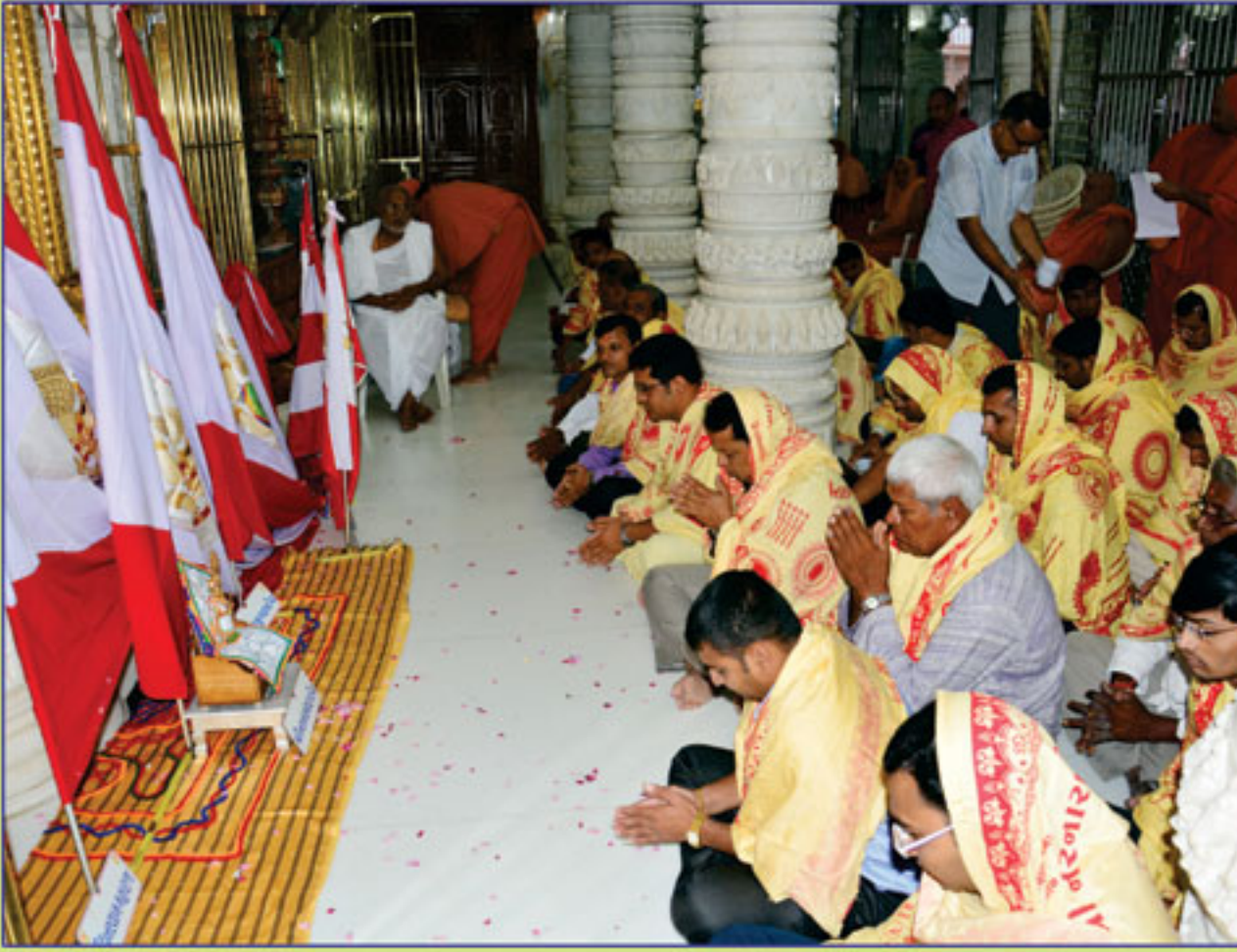
પરીવર્તની એકાદશીના શ્રી નરનારાયણદેવ આદિ દેવોનું ધજાનું પૂજન કરતા યજમાનશ્રીઓ, ભુજ.