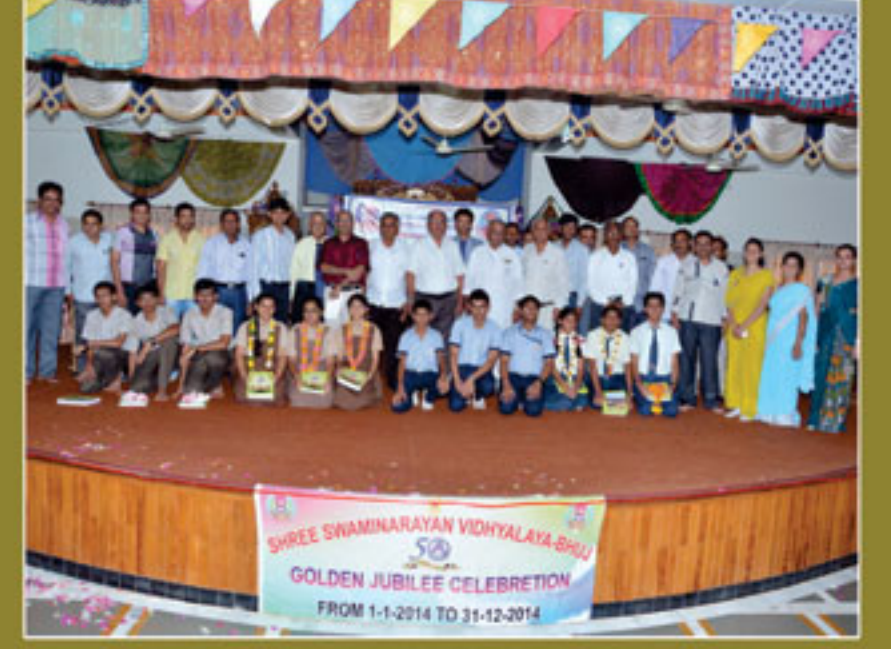
વિજેતા વિદ્યાર્થીઓ સાથે ટ્રસ્ટીઓ, શિક્ષકગણ અને મહેમાનો.