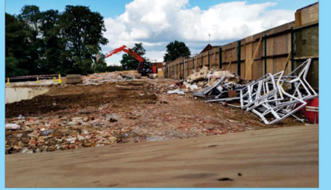
શ્રી કચ્છ સત્સંગ સ્વામિનારાયણ મંદિરના નવનિર્માણ માટેની તૈયારી-વુલ્વીય. યુ.કે.