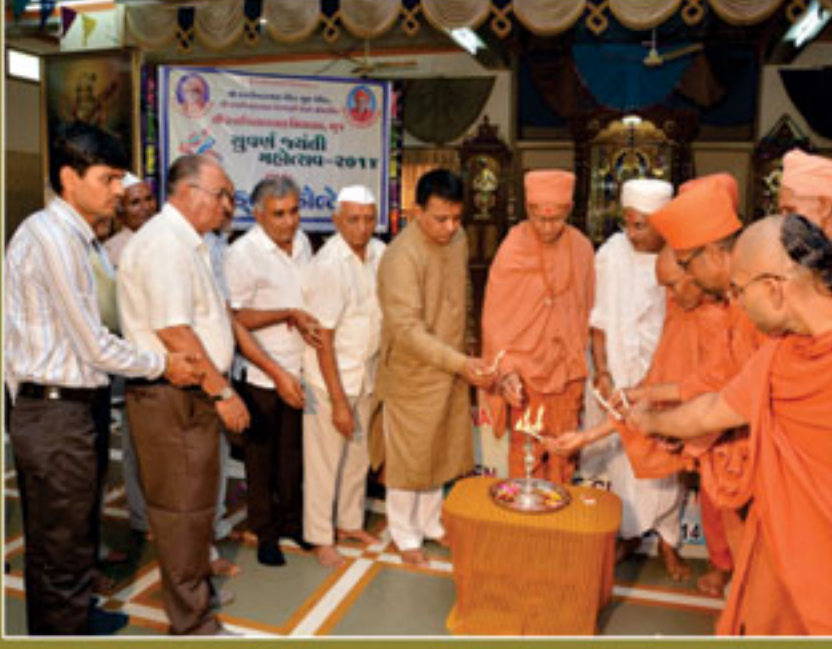
આંતરશાળા સ્પર્ધાઓનો મંગલ પ્રારંભ દિપ પ્રાગટ્ય કરતા સંતો, ટ્રસ્ટીઓ