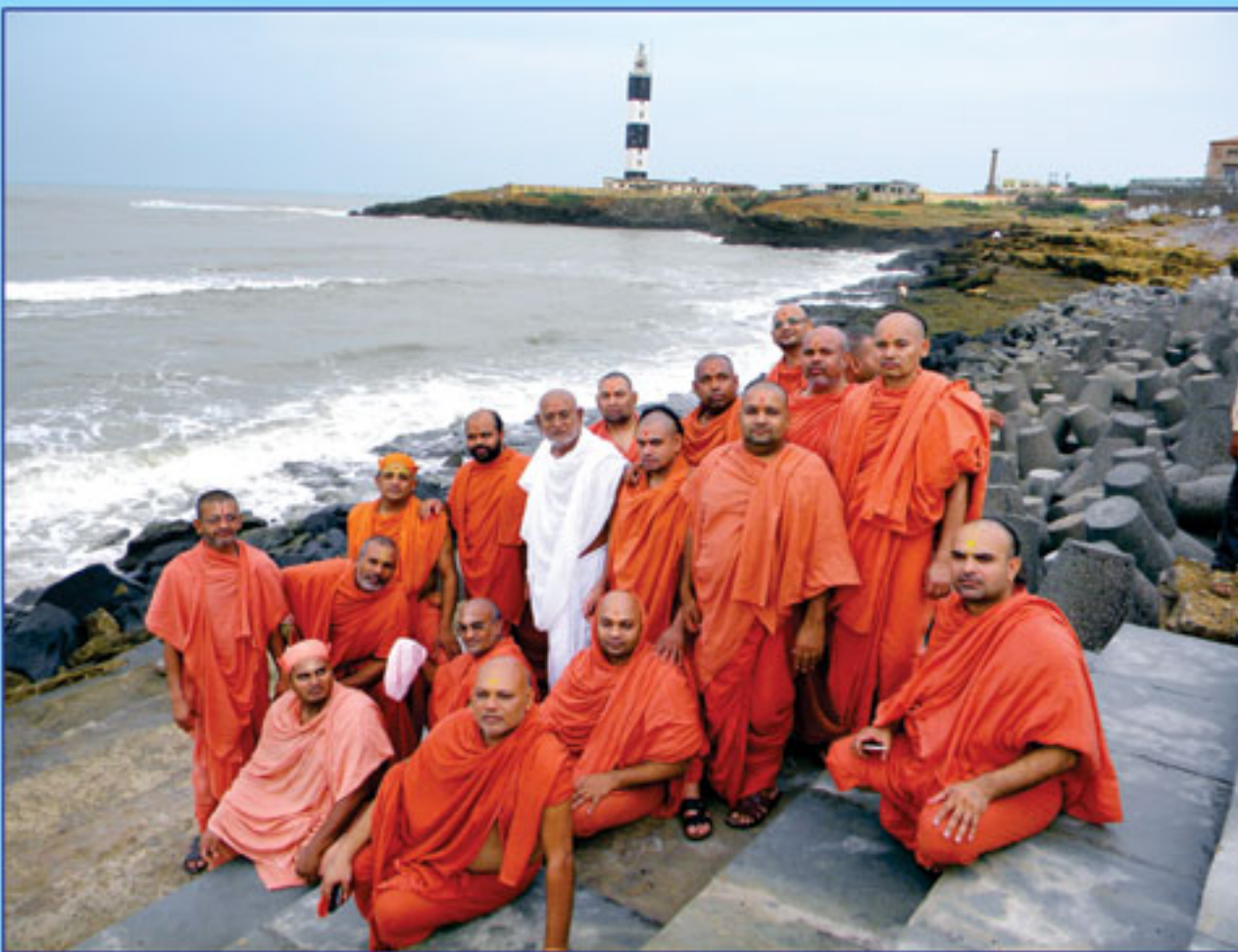
તીર્થરાજ શ્રી દ્વારકા અને ગીરનારની યાત્રાએ પધારેલા સંતો-ભુજ.