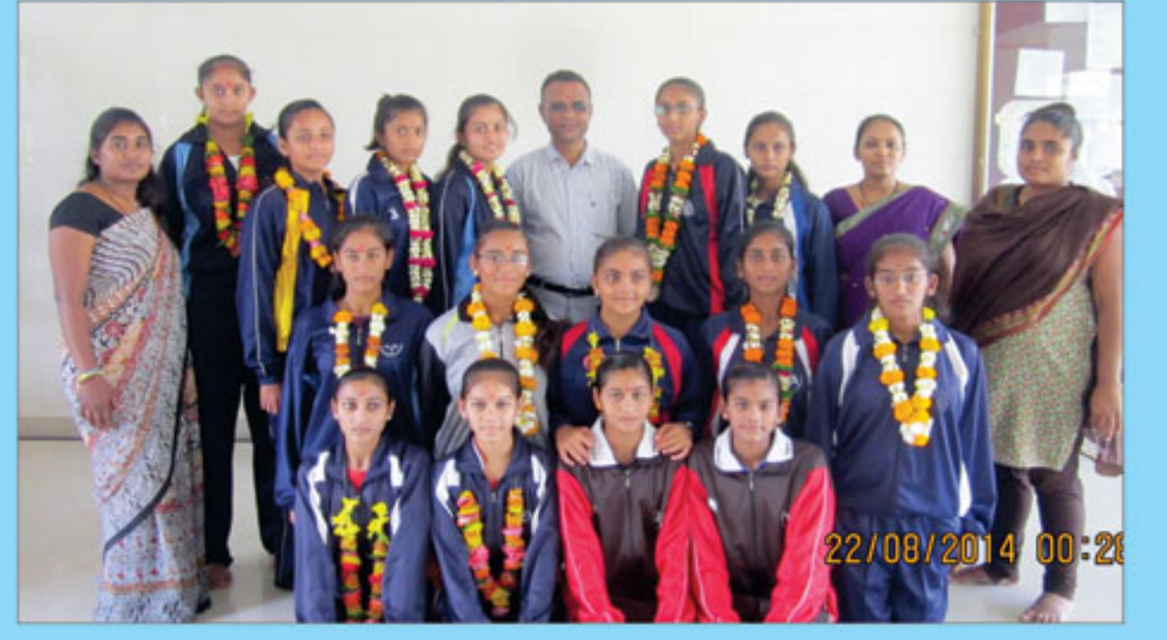
શ્રી સ્વામિનારાયણ કન્યા વિદ્યાલય, ભુજમાં સ્મૃત-ગમત ક્ષેત્રે રાષ્ટ્રીય કક્ષાએ વિજેતા થયેલ વિદ્યાર્થીનીઓને અભિનંદન આપતા મંત્રીશ્રી, આચાર્યશ્રી અને વ્યાયામ શિક્ષિકા.