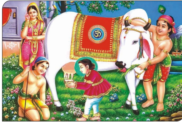
ગોમતી ગાયનો સ્નેહ.

એક સમય ભક્તિમાતા કહે છે, “ઘમશ્યામ, તમે ટાઢી ખિચડી ધીરે ધીરે જમો, ત્યાં સુધી હું ગોમતી ગાય દોહી આવું... પછી દૂધ ને ખિચડી જમજો.” ભક્તિમાતા ગાય દોહવા ગૌશાળામાં ગયા. ત્યાં પ્રભુએ શું કર્યું? જમવાનું મૂકીને પવાલુ લઈને ગૌશાળામાં પહોંચી ગયા. ગાયના આંચળ નીચે પવાલું ઝાલ્યું.