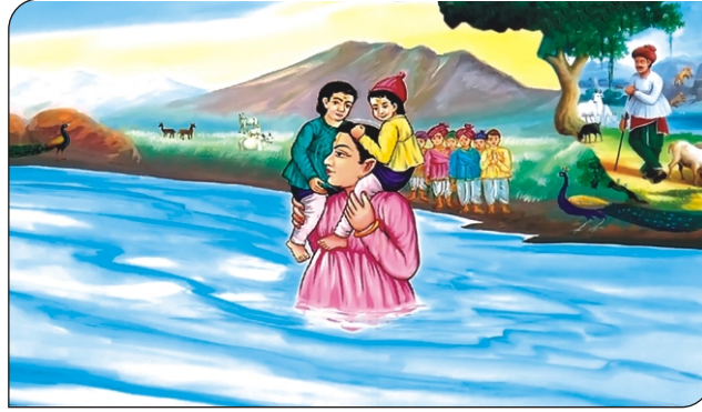
બાલમિત્રોને પ્રભુએ નદી પાર કર્યા.

“હે મિત્રો, તમે આવો મારા ખભા ઉપર બેસી જાવ.” બે મિત્રો ઘનશ્યામમહારાજના સ્કંધે બેસી ગયા. જાણે વહાણમાં બેઠા હોય તેમપ્રભુ ઊંડા જળમાં તરતા તરતા જાય છે. ભવસાગરના તારનાર ત્રિભુવનપતિને સર્જનદી તરતાં શું વાર લાગે! ચાર ગાઉં સુધી તરતા ગયા. મિત્રો આનંદથી પ્રભુના ખભા ઉપર બેઠા છે. બિલ્વા બજારના કિનારે પહોંચી ગયા. સખા પ્રભુને પગે લાગી ને બોલ્યા, “ઘનશ્યામભૈયા, તમે અમને જબરપુરથી બચાવ્યા, નહિતર અમારું શું થાત? મૃત્યુમાંથી બચાવી લીધા. ઘનશ્યામ... મિત્ર તો તારા જેવા જોઈએ. દુઃખમાં સહાય કરે.” પ્રભુ સાથે મિત્રતા કરજો, એ ભવસાગરનાં દુઃખથી બચાવી લેશે.