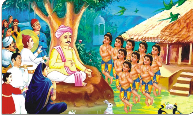
નવ યોગેશ્વર પધાર્યા.