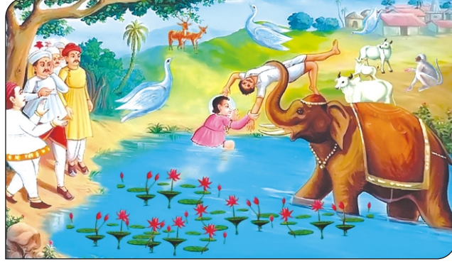
હાથી થકી મહાવતની શ્રી ઘનશ્યામ મહારાજ રક્ષા કરે છે.