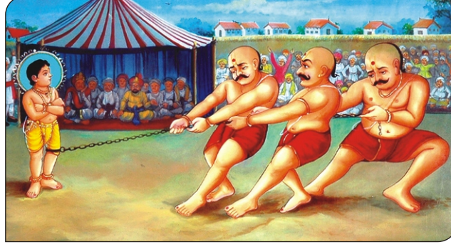
શ્રી ઘનશ્યામ મહારાજ મલ્લોનો ઘમંડ ઉતારે છે.