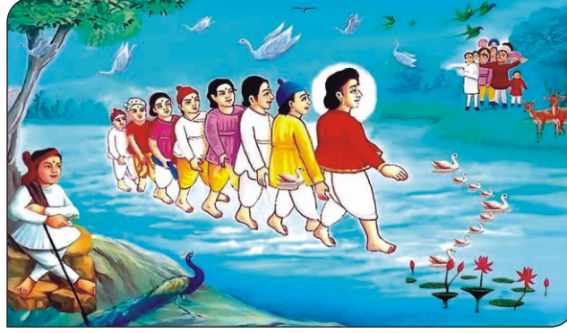
પાણી ઉપર ચાલ્યા.

આવો. હમણાંજ ઘરે પહોંચી જઈશું.” મિત્રો બોલ્યા, “પાણીમાં કેમચલાશે?! ડૂબી જવાય તો?” પ્રભુ કહે છે, “ફીકર ન કરો. હું તમારી સાથે છું. મારી ધોતી પકડીને મારી પાછળ ચાલો. પૃથ્વી ઉપર ચાલીએ તેમપાણી ઉપર ચાલતું જવાશે. વરસાદ આપણા ઉપર નહિ પડે.” પ્રભુ આકાશ સામું જોઈને બોલ્યા, “હે મેઘરાજા, અમારા ઉપર એક ટીપું પાણીનું પડવા દેશો નહિ.”