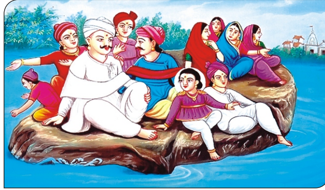
પથ્થર ઉપર પાણીમાં મુસાફરી.

તત્કાળ સામે કાંઠે પહોંચી ગયા. સર્જુ કિનારે માણસો ઊભા હતા તે આવો અદ્ભુત ચમત્કાર જોઈ સ્તબ્ધ થઈ ગયા. “ઓ...હો... આવા મોટા ડુંગર જેવા પથ્થર પાણીમાં તરે છે.” બધા જોતા જ રહી ગયા. આ સાધારણ બાબત નથી. મહા આશ્ચર્યની વાત છે. આ નાના બાલ ઘનશ્યામસાક્ષાત્ પરમાત્મા છે. ભગવાન સિવાય આવું કાર્ય કોઈ કરી શકે નહિ.