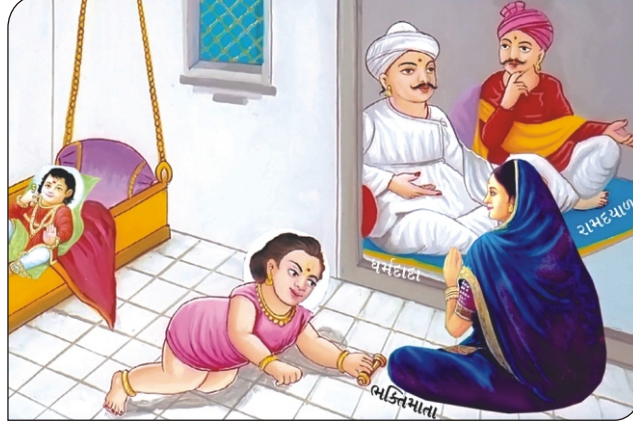
રામ દયાળને દર્શન.