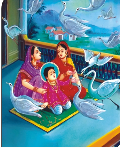
માન સરોવરના હંસો ઘનશ્યામ મહારાજની બ્રીસી લે છે.

અદ્ભૂત ચમત્કાર છે. મોતી લઈ જાઉં ને સાસુજીને બતાવું. હથેળીમાં મોતી લઈને ઘર તરફ આવે છે... ત્યાં તો આકાશમાંથી હંસ આવ્યા. પ્રસાદી જાણીને ચાંચમાં મોતી લઈને ઉડી ગયા. આગળ જતાં અદ્રશ્ય થઈ ગયા.