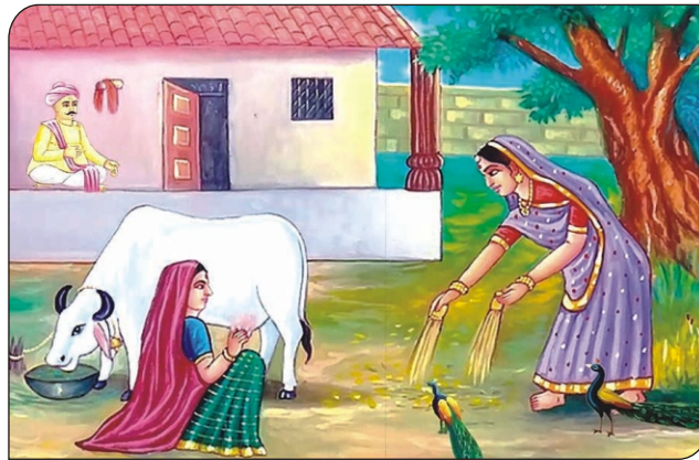
પિતાજીનો સંકલ્પ પૂરો કર્યો.

શ્રી હરિએ તે ધાર્યું સંબંધ, પત્ર પડતાં રહેજો હવે બંધ । પાન ખરે નહિ તે જ સાડું, એવું શ્રી હરિએ મન ધાર્યું ॥