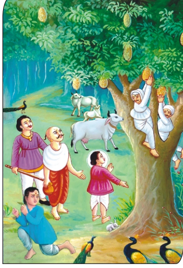
ચોર ચોંટી ગયા.