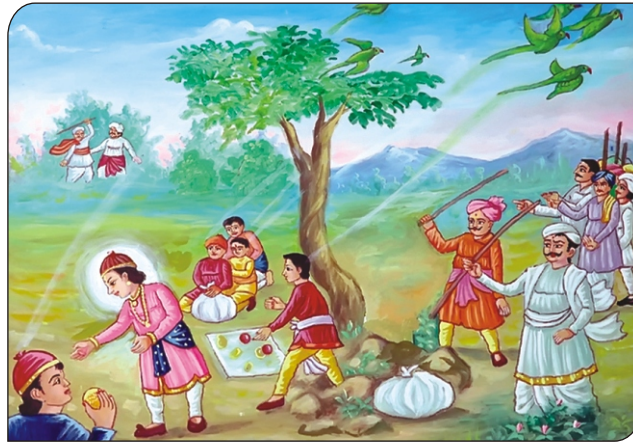
બાલ સખા પોપટ થઈ ઉડી ગયા.

પુરુષોતમે તે ઝટપટ, સખાને કરી દીધા પોપટ । આજ્ઞા આપીને ઉડાડી મૂક્યા, કરી ચતુરાઈ તે નવ ચૂક્યા ॥ જઈ બેઠા ખાંપા સરોવર, થયા અદ્રશ્ય ત્યાં નટવર ।