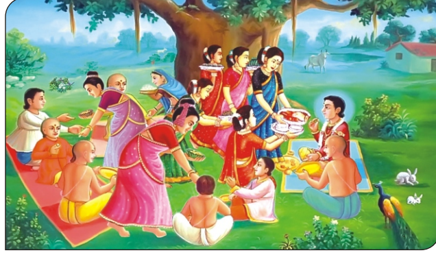
અષ્ટિસિદ્ધિ બાળપ્રભુને જમાડે છે.

તે વખતે જગતસૃષ્ટા બ્રહ્માજી પ્રસાદ જમવાની ઈચ્છાથી જ્યાં પ્રભુ જમે છે ત્યાં આવ્યા. માછલાનું રૂપ લઈને જળમાં પ્રવેશ કર્યો... પ્રભુ જમ્યા પછી મીનસાગરમાં જળમાં હાથ ધોવા આવશે. ત્યારે પ્રસાદી મળશે... અંતર્યામી પ્રભુ બોલ્યા, “વહાલા મિત્રો, આજે કોઈ સરોવરમાં હાથ ધોવા જાશો નહિ... પાણીમાં મોટો મગર છે... હાથ ધોવા જાશો તો મગર પકડશે... “ મિત્રો ડરી ગયા... “રેતીમાં હાથ ઘસી લ્યો.” કોઈ હાથ ધોવા ગયા નહિ... હવે શું કરવું?