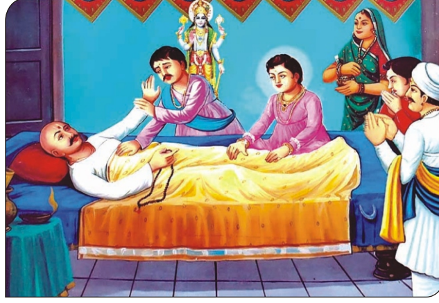
ધર્મદેવ સ્વધામ પધારે છે.