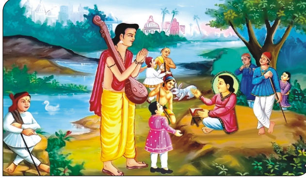
નારદજી પ્રભુનું આગમન કહે છે.

“ગોરખપુર સંજયવિપ્રના ક્ષેત્રમાં પધારશો તેની સેવા અંગીકાર કરી જનકપુરીથી હિમગિરિ પધારશો. ત્યાંથી પુલહાશ્રમમાં તીવ્ર તપશ્ચર્યા કરી અનેક જીવાત્માનો ઉધ્ધાર કરશો. ત્યાંથી બુટોલનગર પધારશો. ત્યાંથી ગોપાલયોગી પાસે પધારી અષ્ટાંગયોગ શીખવશો. નિજ સ્વરૂપનું જ્ઞાન આપી, હે પ્રભુ, તમે નવલખા પર્વતપર વિચરણ કરી યોગીઓનો ઉધ્ધાર કરશો. ત્યાંથી નસિદપુર પધારી રાજાની સેવાનો સ્વીકાર કરશો. પછી જગન્નાથપુરીમાં પધારી અનેક અસુરોનો દ્રષ્ટિમાત્રથી નાશ કરશો. ત્યાંથી સત્રધર્મરાજા પાસે પધારી તેમને મોક્ષનો માર્ગ બતાવશો.