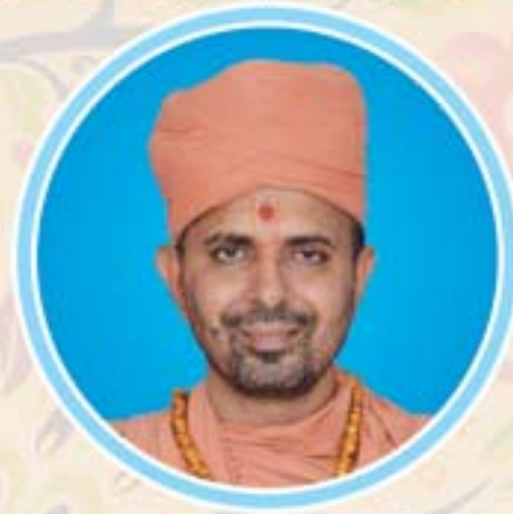
સ.ગુ. સ્વામી જ્ઞાનપ્રકાશદાસજી